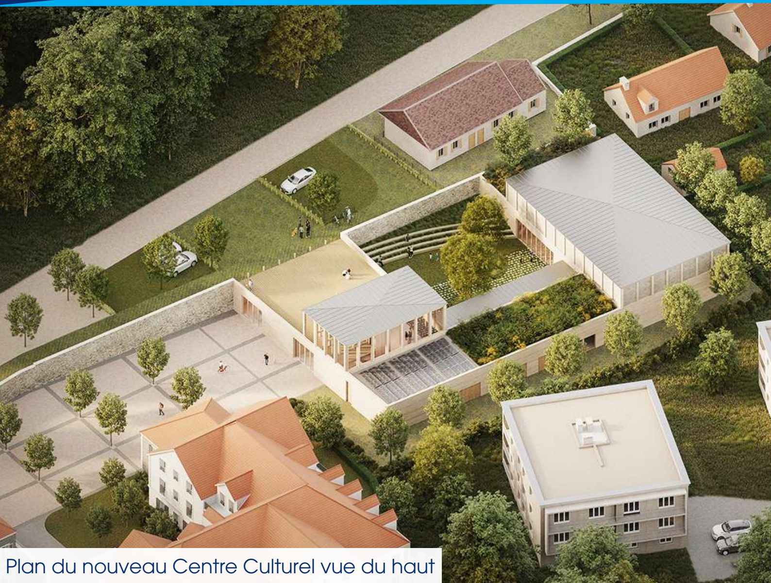
Plan du nouveau Centre Culturel vue du haut