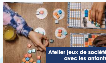
Atelier jeux de société avec les enfants

Commission "Culture, mémoire et patrimoine"