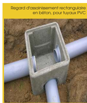
Regard d'assainissement rectangulaire en béton, pour tuyaux PVC

Il s'agit d'une structure souterraine utilisée dans les réseaux d'évacuation des eaux usées, des eaux pluviales ou des eaux mixtes. C'est une sorte de petite chambre d'accès, généralement en béton ou en plastique, qui permet d'inspecter, d'entretenir ou d'intervenir sur les canalisations. Un dispositif constitué d'un puits d'accès (vertical) relié aux canalisations, visant à faciliter l'entretien et la maintenance du réseau.