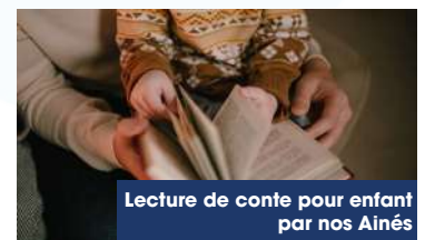
Lecture de conte pour enfant par nos Aînés