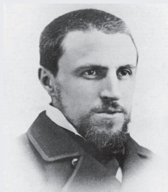
Gustave Caillebotte, peintre français, collectionneur, mécène et organisateur des expositions impressionnistes du XIXème siècle.

Pour rendre hommage à Gustave Caillebotte qui était à l'honneur au musée d'Orsay en ce début d'année, la bibliothèque vous propose une sélection de documentaires sur cet artiste. Ouvriers, régatiers, fâneurs urbains, hommes au balcon ou nus à leur toilette : chaque figure masculine peinte par l'artiste est saisie avec un réalisme poignant. Caillebotte est souvent décrit comme un observateur attentif des transformations sociales et urbaines de son époque. Il est surtout connu pour son rôle dans la promotion de l'Impressionnisme. En tant que mécène, il a soutenu financièrement ses contemporains Monet, Renoir et Degas, et a contribué à rendre ce mouvement incontournable dans l'histoire de l'art.