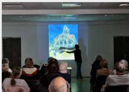
Le programme d'animations de la bibliothèque de Champagne propose tout au long de l'année des conférences de l'histoire de l'art, des ateliers robotiques, des ateliers lectures et des interventions de conteurs pour toute la famille.