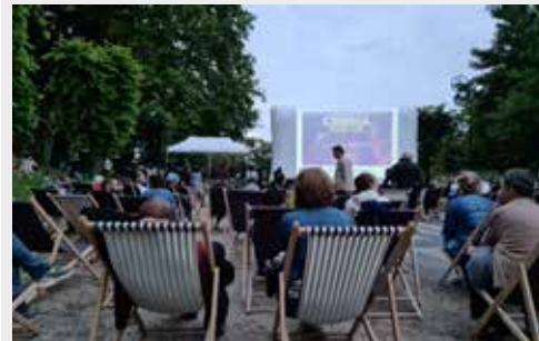
Depuis 2021, le cinéma plein air est un rendez-vous incontournable du début d'été.