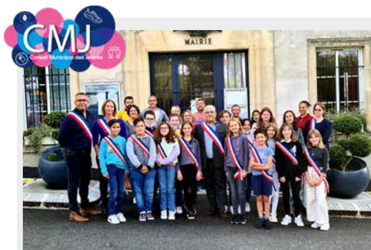
2021 - Séance d'installation du Conseil Municipal des Jeunes.

Plus de 68 000€ sont répartis chaque année entre les associations Champenoises. Cet investissement municipal témoigne, malgré le contexte économique complexe, du soutien indéfectible de la commune aux associations sportives, de loisirs, d'histoire et de mémoire, sans oublier les associations de parents d'élèves. Le lien social est au cœur de la vie Champenoise et doit le rester.