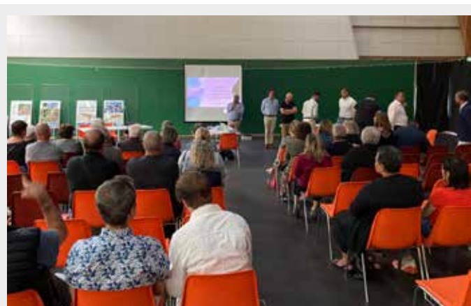
31 mai 2023 : Réunion publique destinée aux riverains du projet Centre Bourg pour la présentation du promoteur retenu.

L'accès de chacun aux services de proximité est une priorité du mandat en cours. Qu'il s'agisse des services de secours (pompiers, police) ou des besoins essentiels (santé, alimentation, profession médicale et paramédicale) ou de formalités administratives, la Municipalité s'engage, depuis 3 ans, à faciliter la vie des Champenois avec des services accessibles et efficaces.