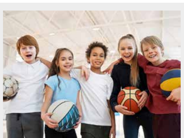
2022 - L'accueil du "vendredi sportif" est un lieu de rencontre ouvert aux enfants de 11 à 16 ans (à partir de la 6 ème ) de la ville de Champagne-sur-Oise, chaque vendredi soir entre 16h30 et 19h (hors vacances scolaires).

L'accès à ce lieu est libre selon les horaires définis ci-dessus.